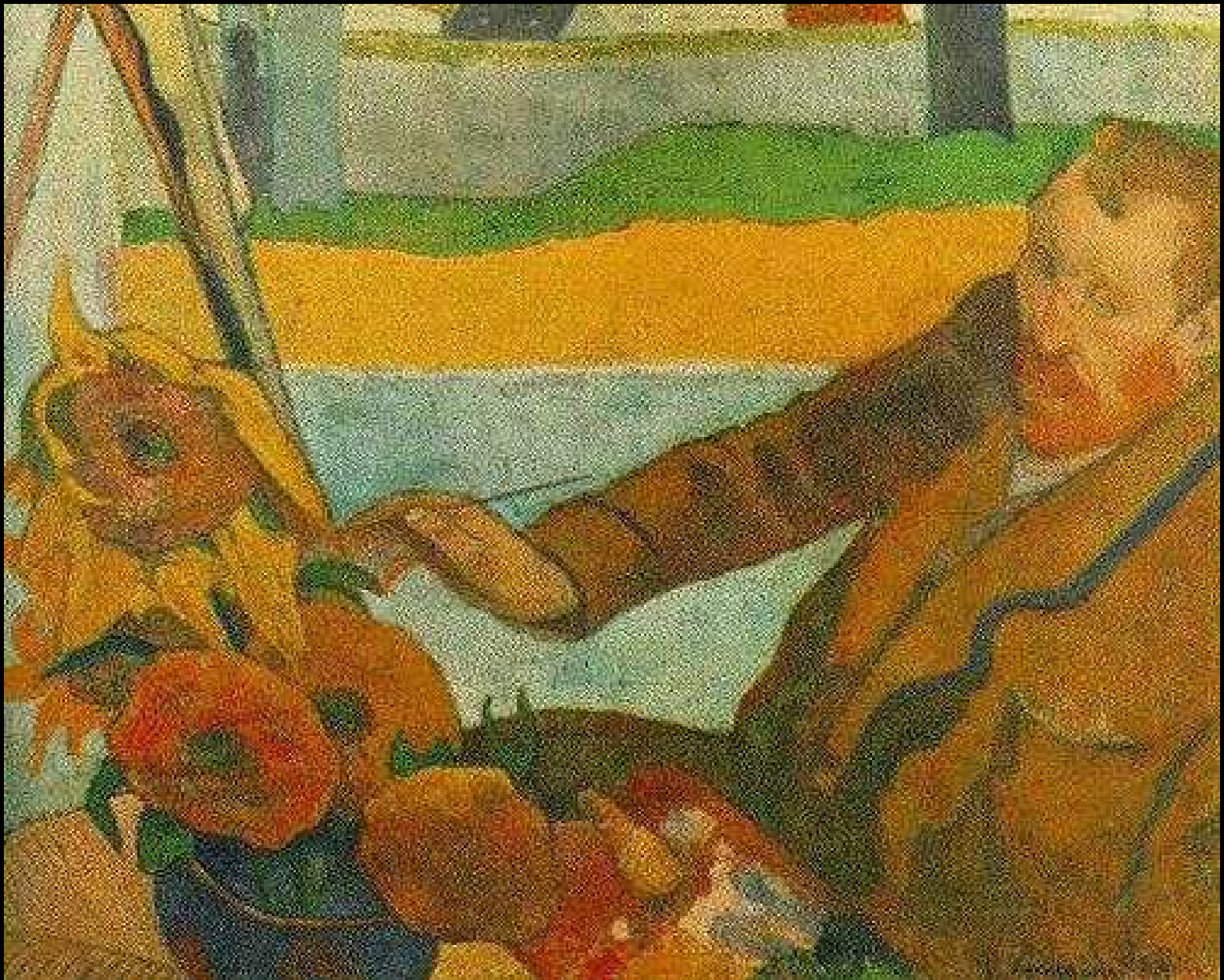
Van Gogh pintando girasoles. Henry Matisse 1888