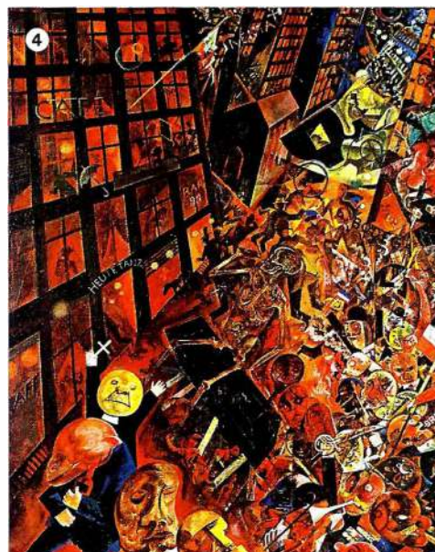
4 El entierro del poeta Oskar Panizza , George Grosz, 1917-1918. Stuttgart, Staatsgalerie.

En general, los colores de la gama cálida del círculo cromático transmiten alegría, energía y dinamismo.