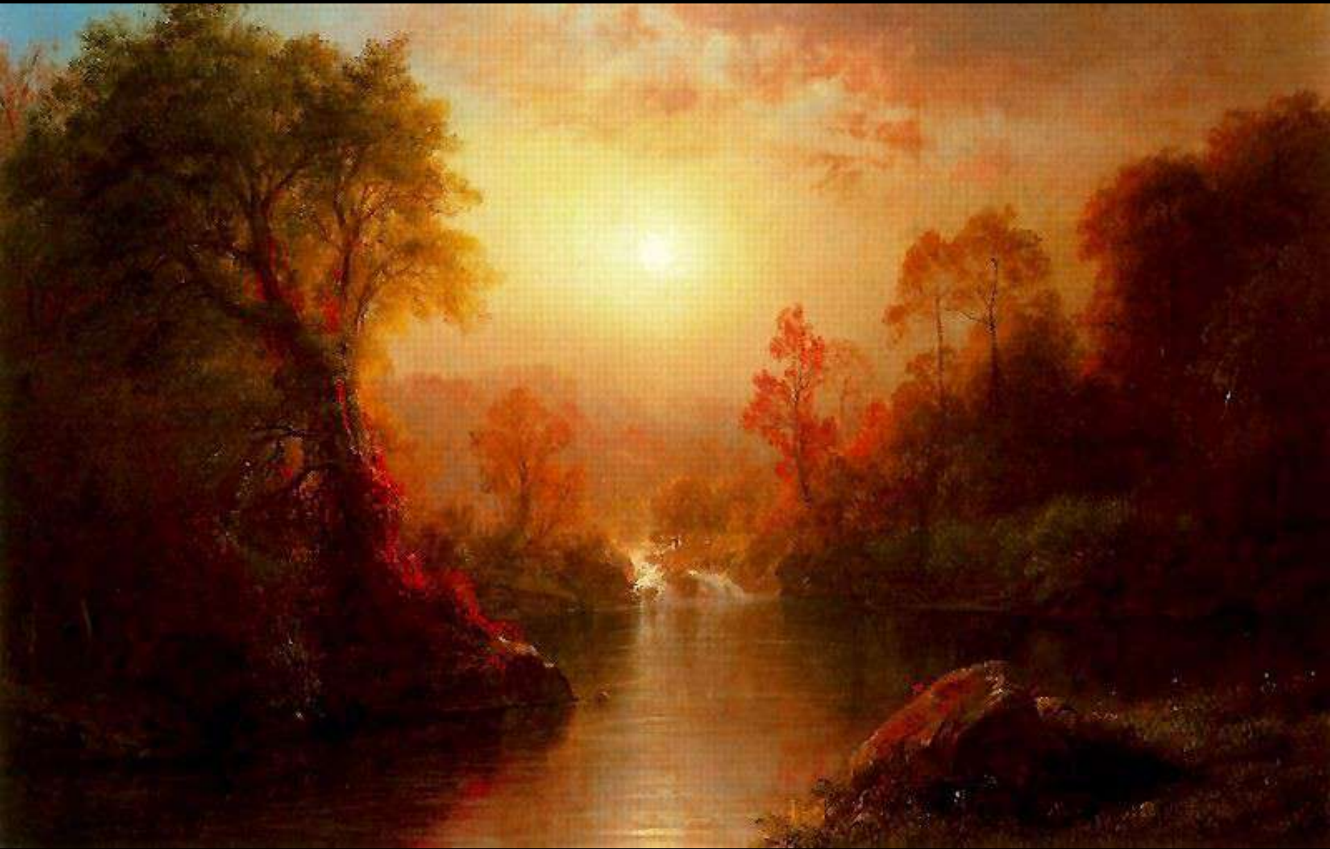
Frederic Edwin Church