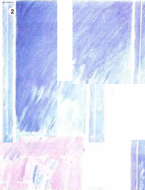
2 Azul sostenido , Albert Ràfols Casamada, 1978. Barcelona, colección Alier.

En medio de un paisaje desolado de tonos azules, vemos a una mujer con un niño en brazos que sostiene una flor roja, símbolo de esperanza.