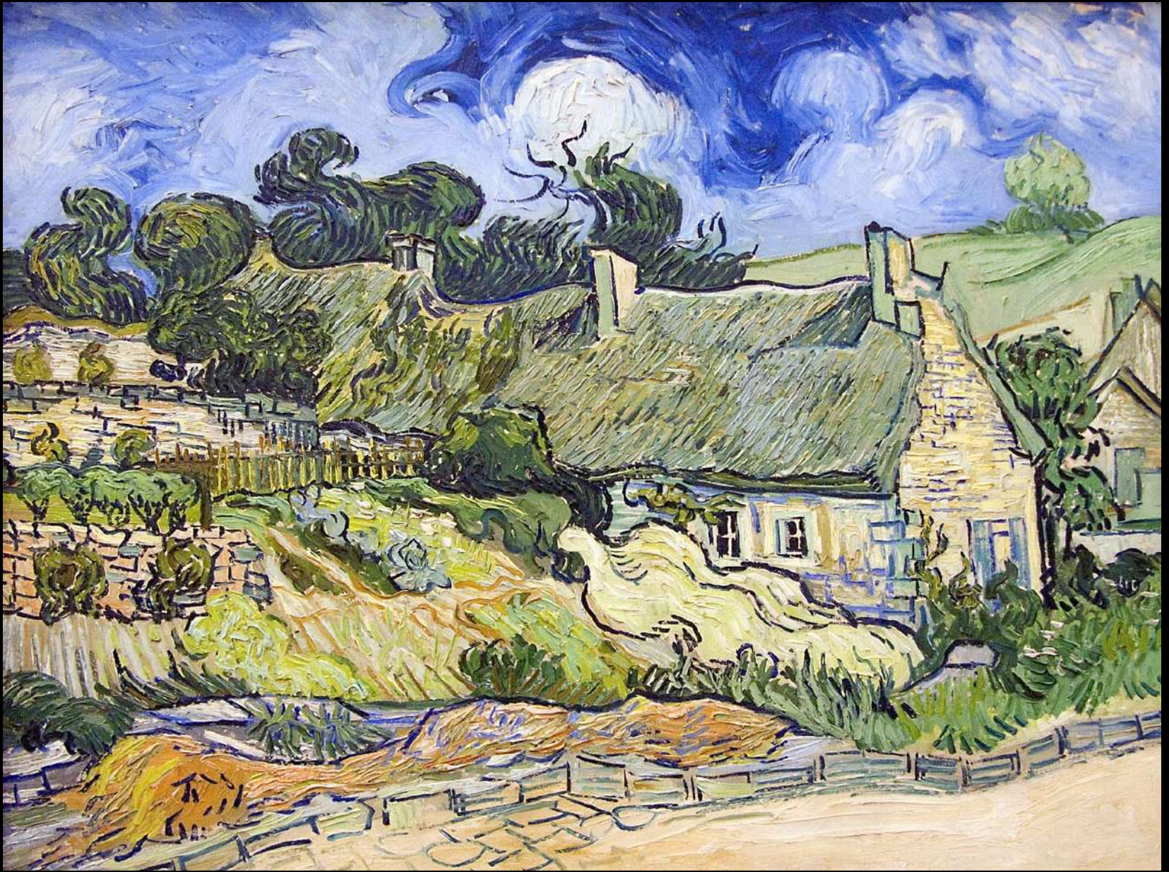
“Casas con tejado de paja en Cordeville” Vincent Van Gogh. 1890