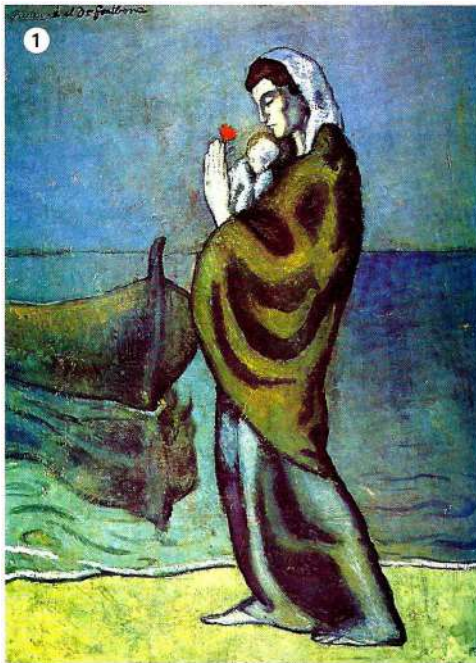
1 Maternidad cerca del mar , Pablo Picasso, 1902. Basilea, colección Beyeler.

En medio de un paisaje desolado de tonos azules, vemos a una mujer con un niño en brazos que sostiene una flor roja, símbolo de esperanza.