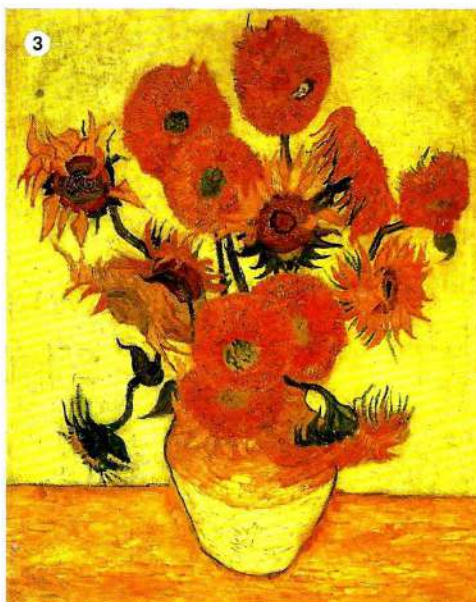
3 Los girasoles , Vincent van Gogh, 1888. Londres, National Gallery.

En general, los colores de la gama cálida del círculo cromático transmiten alegría, energía y dinamismo.